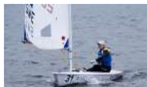
SJÄLVSTUDIER BLOCK 4 DEL 2

Gå nu vidare till resterande frågor och exempel i Självstudier Block 4 del 2.