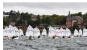
SJÄLVSTUDIER BLOCK 3

Gå igenom alla bilder som handlar om Genomföra en kappsegling och stanna sedan där. Resterande bilder i det självstudieavsnittet kan ni ta på nästa träff.